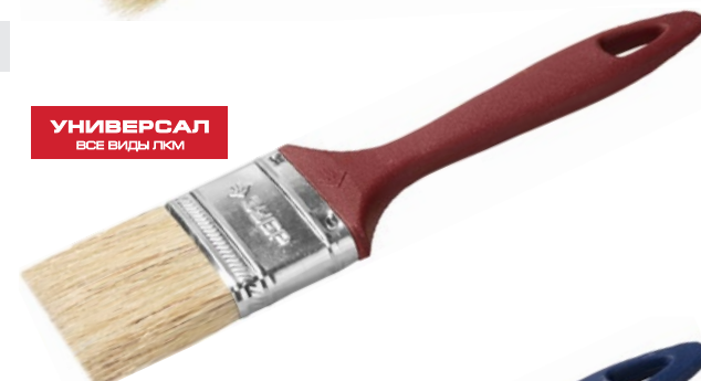
УНИВЕРСАЛ ВСЕ ВИДЫ ЛКМ