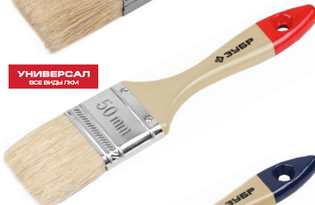
УНИВЕРСАЛ ВСЕ ВИДЫ ЛКМ