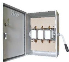
ЯБПВУ - 100 IP 54-009