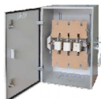
ЯБПВУ - 250 УЗ IP 31, 54