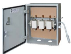
ЯБПВУ - 100 УЗ-003(004) IP 54

Имеется возможность блокировки дверки. Также можно дополнительно заблокировать рукоятку от оперирования висячим замком.