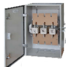
ЯБПВУ - 400 УЗ IP 31, 54