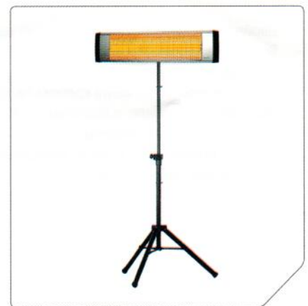
Возможна установка на профессиональный стальной телескопический штатив ВИН-LS-210 (опция)