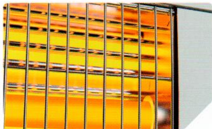
Отражатель с оребрением для 100% равномерного обогрева