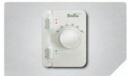
Новый пульт ДУ с электронным термостатом +5...30 °C