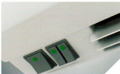
Пылевлагозащищенные клавиши с индикацией режима работы

Новое поколение компактных завес увеличенной эффективности с минимальным уровнем шума