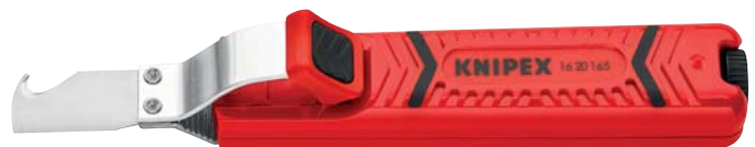
16 20 165 SB