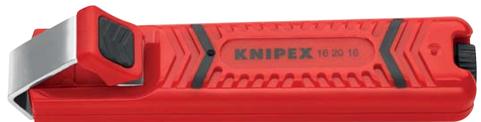
16 20 16 SB