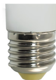
Цветовая температура: 2700K Артикул: 25510