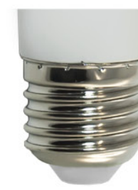
Цветовая температура: 6400K Артикул: 25512