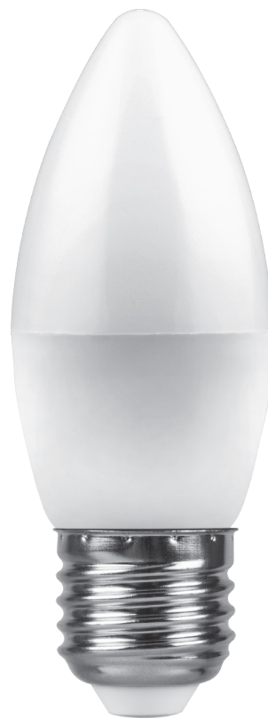
Арт. 25936, 25937, 25938

Светодиодная лампа Feron LB-570 – это современный аналог ламп накаливания и компактных люминесцентных ламп.