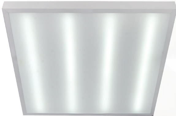
PPL SPEC1 OP